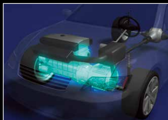
ハイブリッド用電磁クラッチ