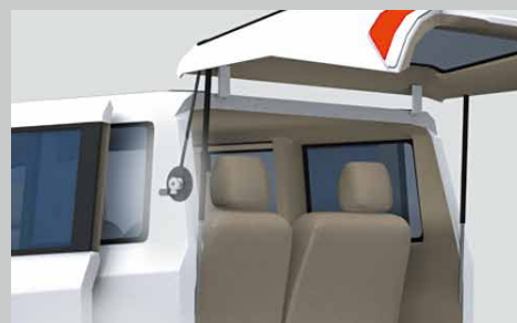
電動バックドア用電磁クラッチ