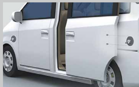
電動スライドドア用電磁クラッチ/ブレーキ