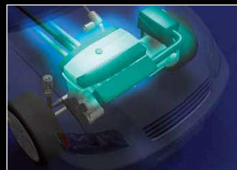
吸排気用電磁クラッチ