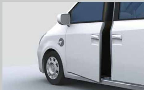
電動スウィングドア用電磁クラッチ/ブレーキ