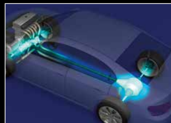
駆動装置用電磁クラッチ