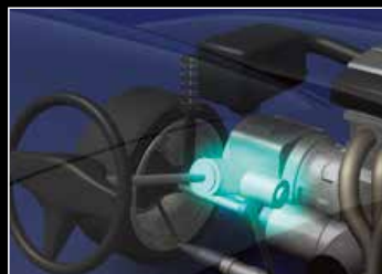
パワーステアリング用電磁クラッチ