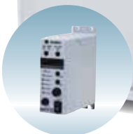
専用コントローラ